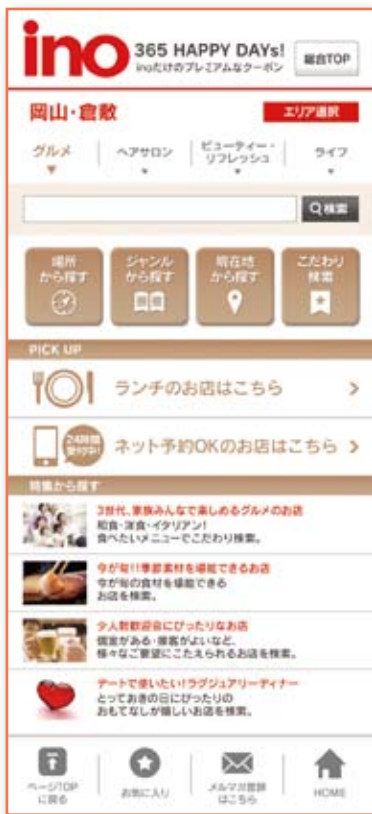
エリアTOPページ(グルメ)

WEBページの開設・運用に際し、弊社の広告掲載基準に基づいた事前審査をお願いする場合があります。